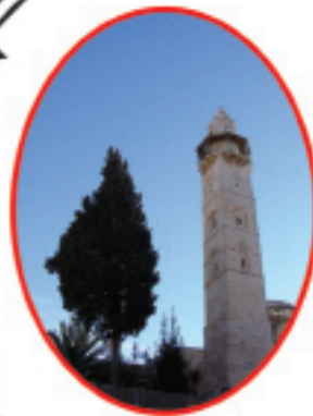
منذنة جامع عمر

تقسم القدس إلى أربعة أقسام على هيئة مربع